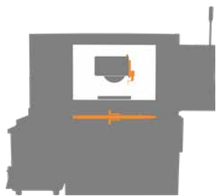
超精密 CNC 成形平面研削盤