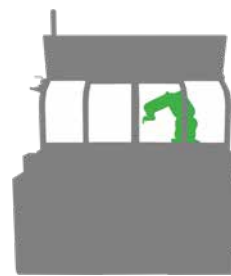
精密小型ネジ研削盤